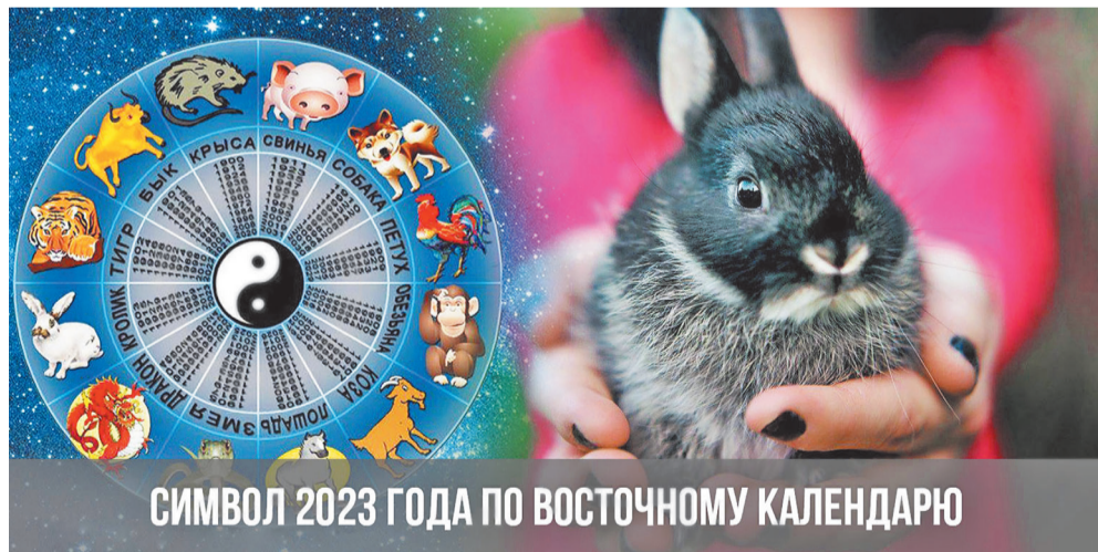
СИМВОЛ 2023 ГОДА ПО ВОСТОЧНОМУ КАЛЕНДАРЮ

Новый год – это любимый праздник с детства, которого ждут абсолютно все. В новогодние праздники сбываются заветные мечты, а в зимние каникулы катаемся на санках, ватрушках, ледянках и коньках. Уже скоро мы будем встречать год черного водяного кролика, и многие интересуются, как нужно отмечать 2023 год?